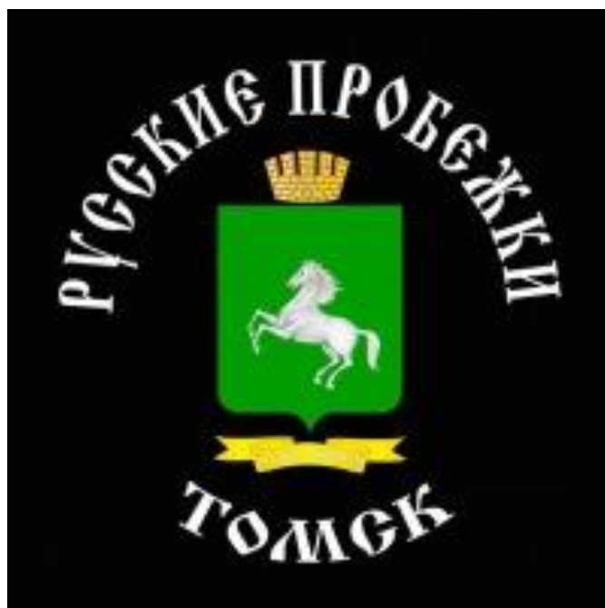
Рис. 5. Эмблема «Русских пробежек» в Томске