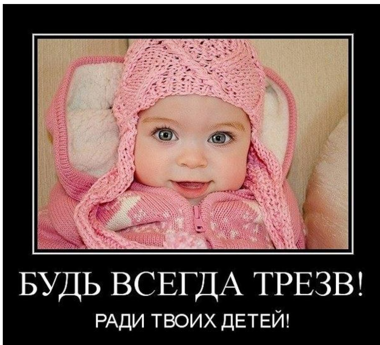
Рис. 6. Плакат «Будь всегда трезв! Ради твоих детей!» // Интернет