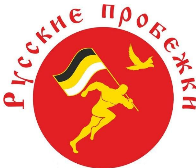
Рис 4. Эмблема движения «Русские пробежки» в России

М.: Сейчас [в некоторых СМИ] складывается такое впечатление, что «русские» – это националисты. Я считаю, что необходимо объединяться под словом «русские». Поэтому так назвали «Русские пробежки», как, например, есть Русские сказки, Русская боевая слава. Это слово должно быть объединяющим, а не разъединяющим. На пробежки может приходить любой желающий, вне зависимости от национальности, главное, чтобы он поддерживал здоровый образ жизни. То есть на национальность мы никак не акцентируем внимание.