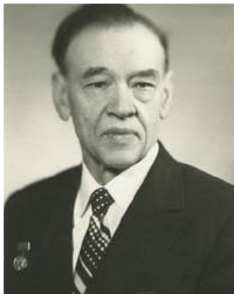
Рис. 1. Фёдор Григорьевич Углов (1904-2008) – выдающийся хирург, академик Российской Академии медицинских наук. Углов был участником Великой Отечественной войны, страстным пропагандистом трезвости. Сохранял работоспособность до ста с лишним лет. Приведённая ниже «Памятка» составлена автором на основании достоверных научных данных и собственного жизненного опыта.

«К здоровью своему, которое тебе подарили при рождении, отнесись разумно и с благодарностью за такой прекрасный, драгоценный дар. Здоровье надо беречь, сохранять, но и не изнеживаться. Если любишь работать — укрепишь душу и тело естественным путем. Лентяй — человек пустой и никому не нужный, никчемный. Он живет бесцельно, за счет других. Долгожителями лентяи не бывают.