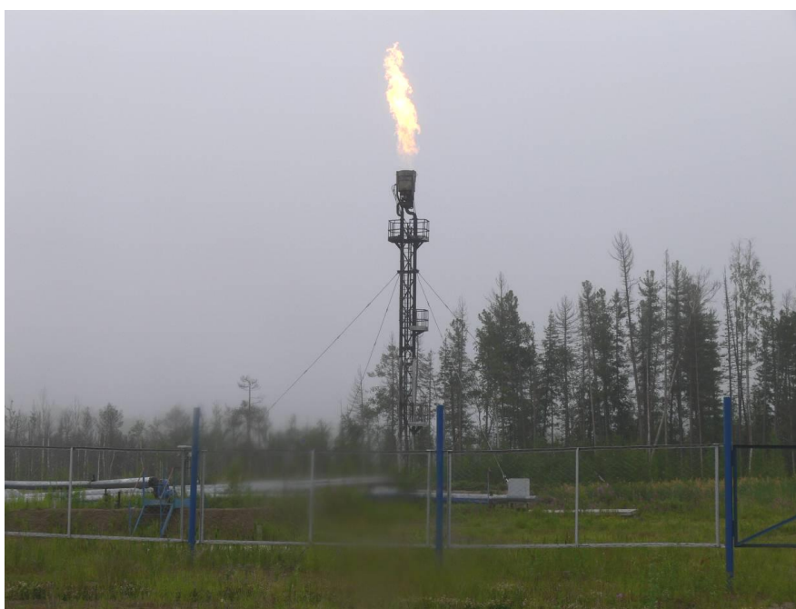
Рис. 1. Факельное хозяйство Березовского месторождения

Для оценки уровня воздействия предприятия нефтедобычи на окружающую среду на территории месторождения ежегодно проводятся мониторинговые наблюдения. В соответствии с утвержденной программой экологического мониторинга на территории месторождения проводится комплекс исследований за состоянием воздуха, поверхностных и подземных вод, почвенного и растительного покрова.