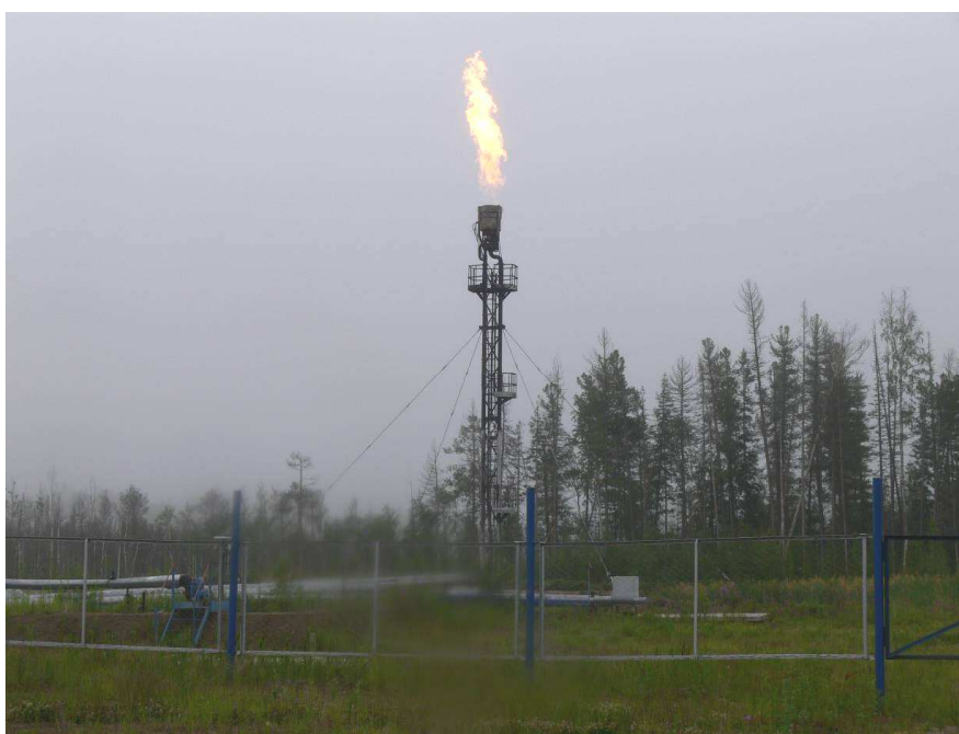
Рис. 1. Факельное хозяйство Березовского месторождения

Для оценки уровня воздействия предприятия нефтедобычи на окружающую среду на территории месторождения ежегодно проводятся мониторинговые наблюдения. В соответствии с утвержденной программой экологического мониторинга на территории месторождения проводится комплекс исследований за состоянием воздуха, поверхностных и подземных вод, почвенного и растительного покрова.