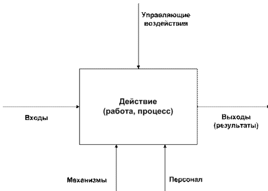
Рисунок 2. Графическая модель бизнес-процесса

Иллюстрации (чертежи, графики, схемы, диаграммы, фотографии) следует располагать сразу после абзаца, в котором они впервые упоминаются, или, если они не умещаются на этой странице, то - на следующей.