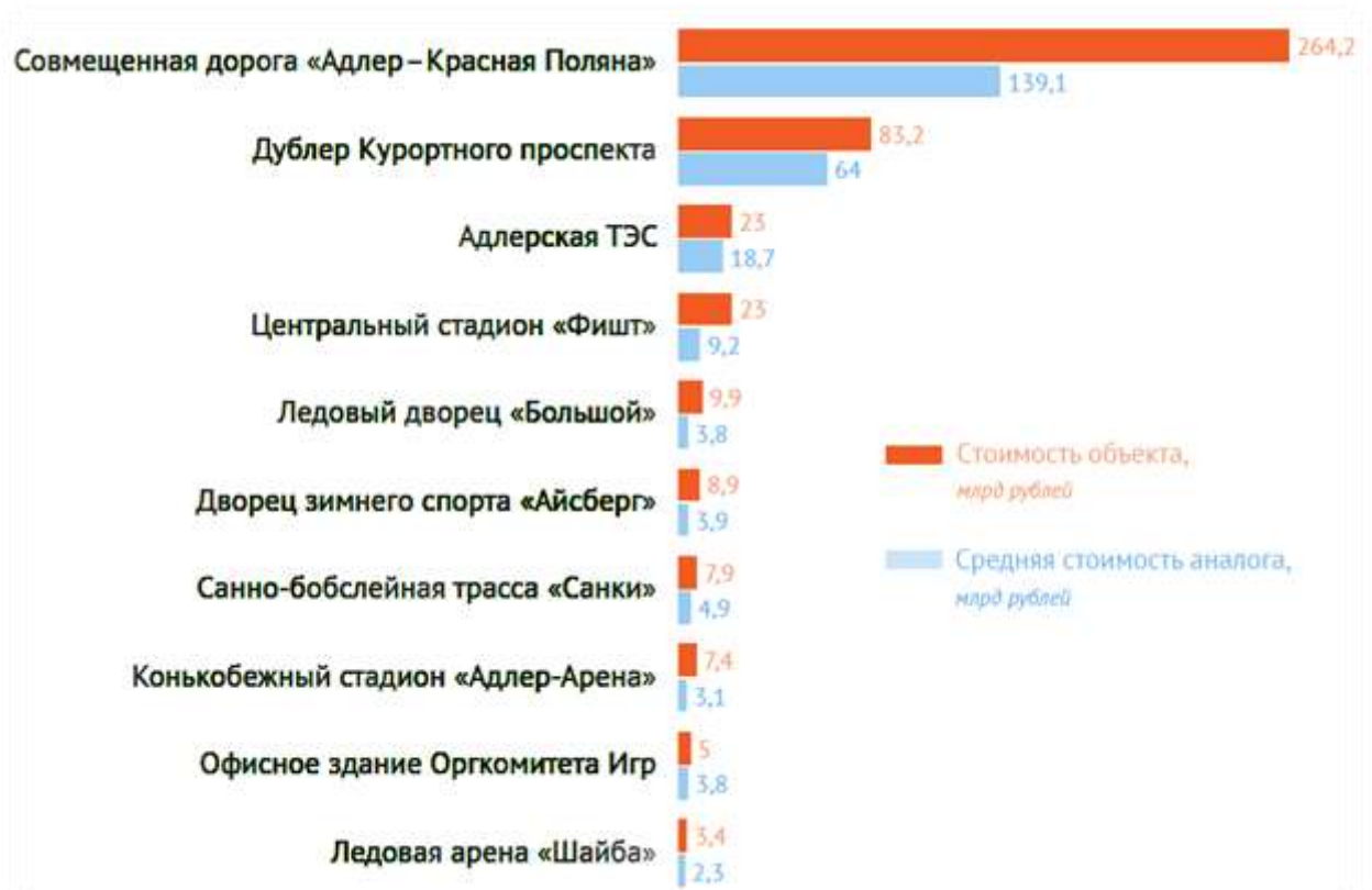
Рис. 2- Сопоставление стоимости объектов с аналогами.

Задание 4. Рассмотрите работу хорошо известной вам организации. В каких признаках проявляется ее устойчивость, стабильность, изменчивость?