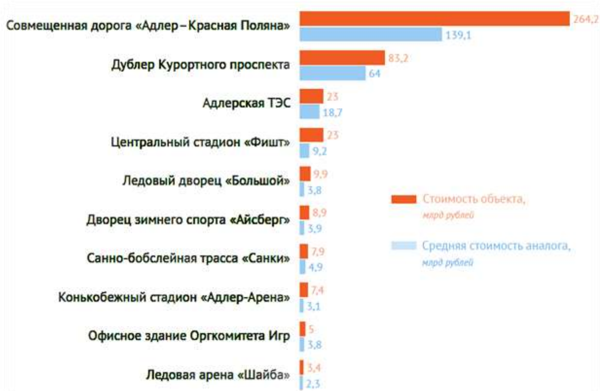
Рис. 2- Сопоставление стоимости объектов с аналогами.