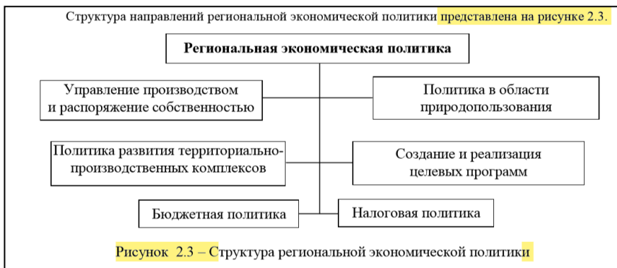
Рисунок 2.6 – Пример оформления рисунка в отчете

Необходимо оформить рисунок (иллюстрацию и график/диаграмму) в тексте работы в соответствии с правилами вуза. Пример оформления с важными местами, на которые следует акцентировать внимание, представлен на рисунке 2.6.