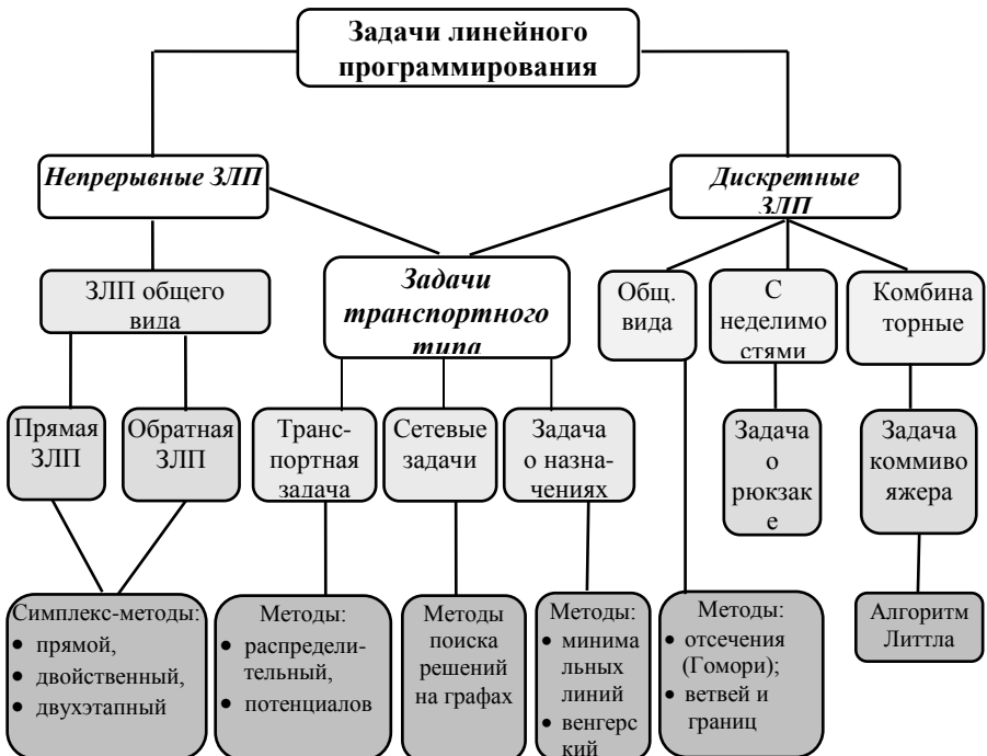
Рис. 2.1. Классификация задач и методов линейного программирования

На рис. 2.1 приводится классификация задач и методов линейного программирования, которые используются при решении задач ИСО.