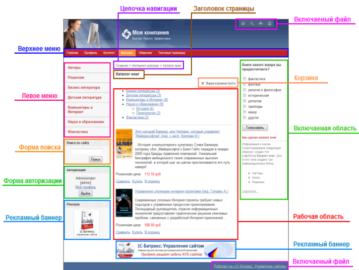
Рисунок 5 – Прототип дизайна сайта

Прототип представляет собой сверстанный в html шаблон дизайн сайта. При верстке в шаблоне выделяются функциональные области. Пример такого выделения представлен на рисунке 5.