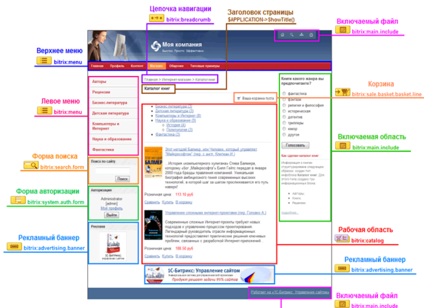
Рисунок 6 – PHP-шаблон дизайна сайта

На этапе создания полнофункционального шаблона дизайна выполняется замена HTML элементов дизайна на соответствующие функциональные элементы: программный код и вызовы компонентов. В результате чего уже получается PHP-шаблон дизайна сайта.