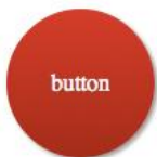
Рисунок 3 – Красная круглая кнопка

Весь этот код приведет к созданию довольно простой, круглой кнопки (Рисунок 3).