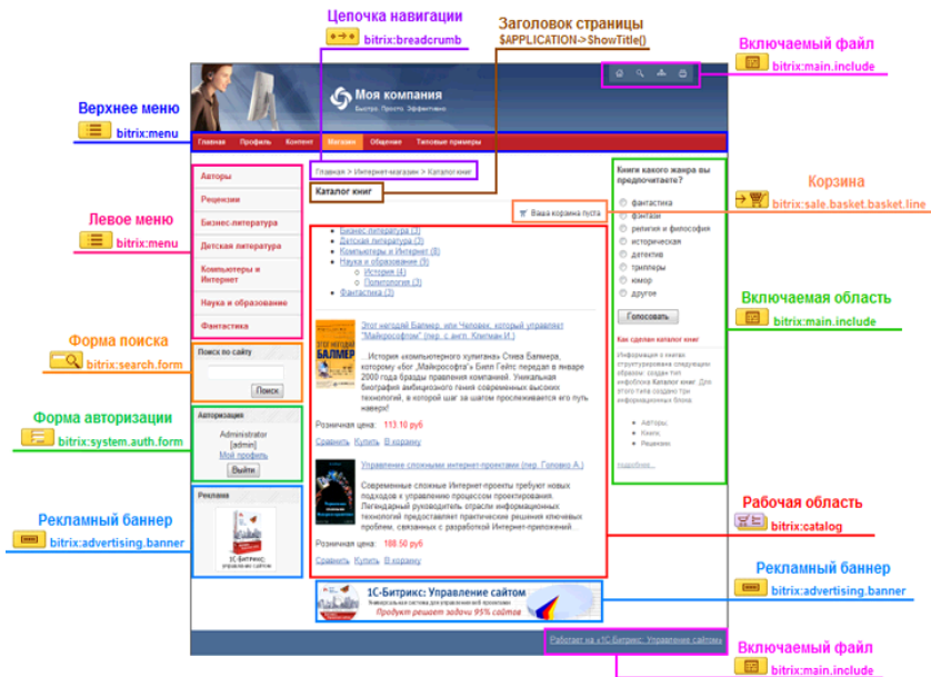
Рисунок 8 – PHP-шаблон дизайна сайта

Основные моменты, которые нужно учитывать при создании шаблона: